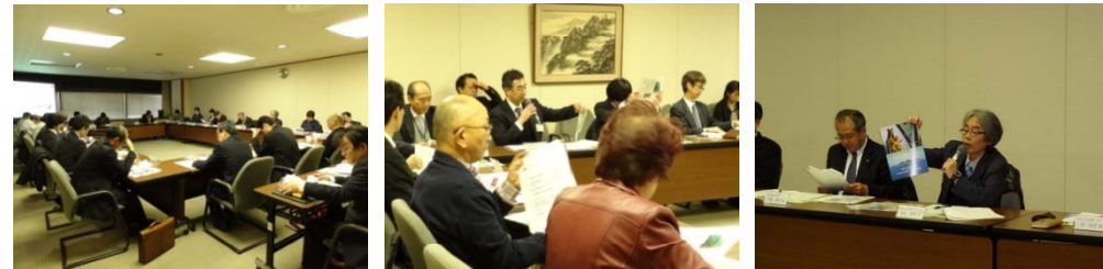
【写真は、会議風景の様子です】

ながさきサンセットロード事務局では、今後も地域連絡会議を通して、地域間の連携強化を行うとともに、引き続き組織の充実を図りながら、地域情報の発信やルート沿いの景観整備などをはじめとした様々な取り組みを進めていきます。