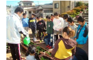
教頭先生より水やりの指導

○アンケート回答情報（長崎市稲佐小学校4年2組）参加者数15名、回答者数15名、回答率100%