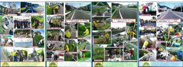
下段左より8月号 6月号 5月号 4月号

現在まで、清掃活動を131回開催されております。 参加者皆さんも「日本一きれいなまち」の意識も高まり、活動を継続されております。