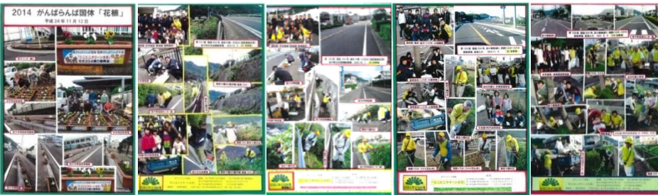
上段左より12月号(2枚) 11月号 10月号 9月号