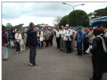
<現地ボランティアガイドによる説明>