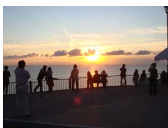
<視点場からの夕日の眺め>