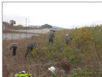
【雑草の処理も一苦労です（左） 雑草に覆われ姿が見えません（右）】