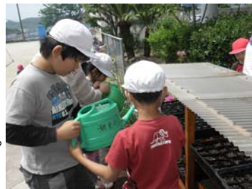
<上より、種植え・水やりの様子>