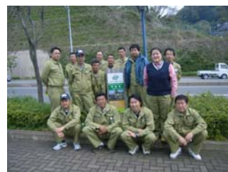
【竹友会の皆さん歩道清掃お疲れ様でした。】

※道守会員の皆様の活動情報を、随時募集しております。情報提供お待ちしております！ 活動情報は、写真と簡単なコメントを添えて、下記住所までお送り下さい。