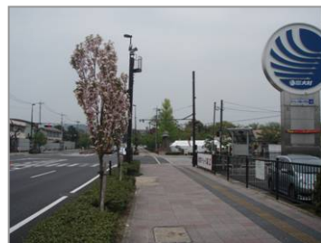
【 3月24日マイツリー清掃活動時（左） 4月18日満開時（右） 】

前号(H24.4月 No.41号)で大村マイツリー活動をお知らせしましたところ。その後、4月18日頃には国道34号大村市役所前の桜（天の川）が見事に満開となりましたので紹介します。