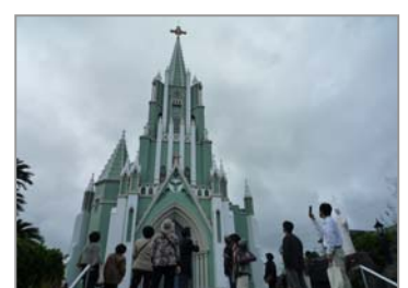
<ツアーコースにある教会>