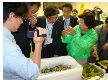
＜昨年の“屋台村”の様子＞