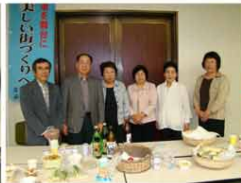
【今年も盛り上げてくれた「環境美化を考える会」】