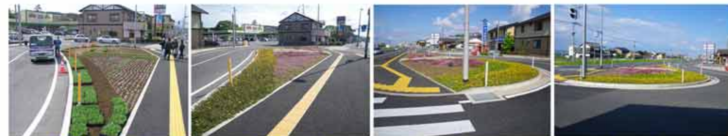
《 Before 》

6月現在、この植栽帯の花がとてもきれいに咲いています。3月に行った花植えでは、子どもたちが花の種類や色、レイアウトを考え、自らの手で植えました。自分たちで作上げた花壇の花が満開になり、子どもたちも大変喜んでいるそうです。通勤・通学でこの道路を毎日利用している人も、美しい花壇に心が癒されているのではないのでしょうか。