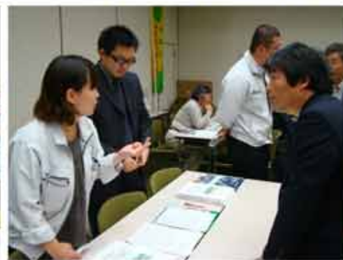
【長崎大学インフラ長寿命化センター】