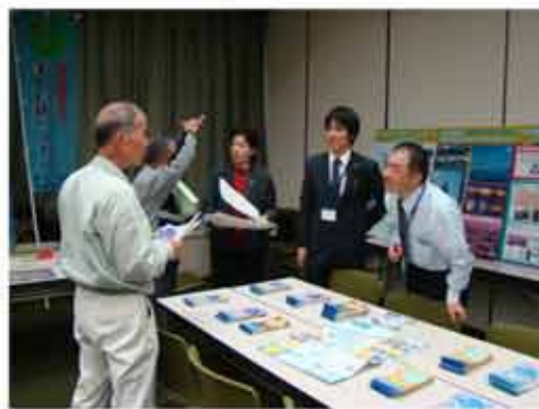
【風景街道「ながさきサンセットロード」のブース】