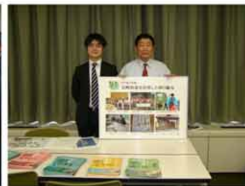
【NPO 道守長崎は長崎街道を活用した取組を紹介】