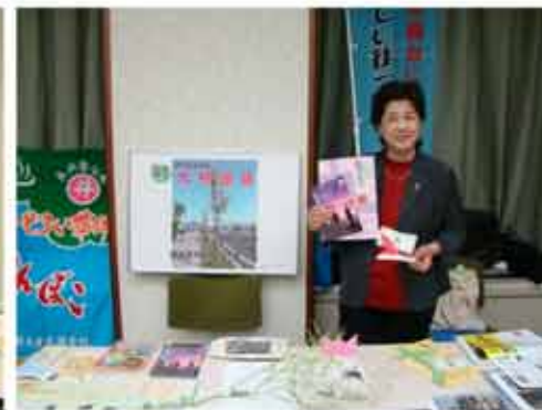
【大村地区は「マイ・ツリー活動」を紹介】