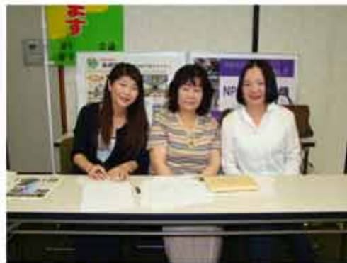
【長崎地区は「うまろかプロジェクト」を紹介】