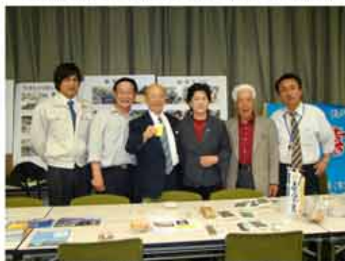
【「小浜温泉57」はジオパークを活用したまちづくりなど様々な分野に挑戦しています】