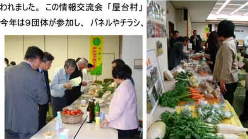
【西海市大島町の「環境美化を考える会」の皆さんが栽培した元気野菜。 生ごみや道守活動で出た草や剪定くずを堆肥化して栽培したものです。】

今年で7回目を迎えた道守長崎会議総会でしたが、参加者の皆さんは積極的に情報交換するなど、今年も大変充実した総会となりました。