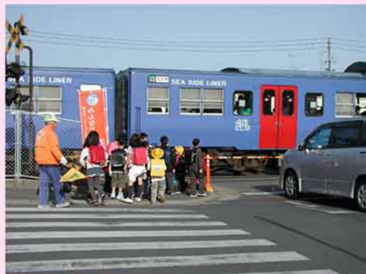
【歩道が狭いので、電車の通過を待つ間とても危険なのです】