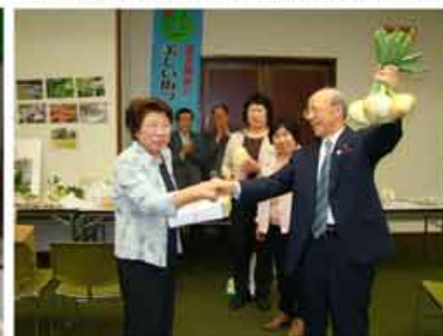
【今年最も評価を得たのは、「環境美化を考える会」】