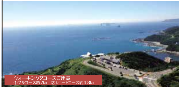
ウォーキング2コースご用意 ①フルコース約7km ②ショートコース約4.8km

～長崎市・外海でウォーキングやサンセットクルーズ、ふるさと祭り&グリーンツーリズムも満喫～