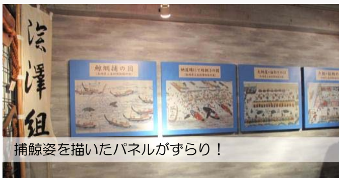
捕鯨姿を描いたパネルがずらり！