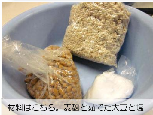
材料はこちら。麦麴と茹でた大豆と塩

川添酢造さんにお邪魔して味噌づくり体験！今回は3キロの麦味噌をつかって持ち帰ることができます。味噌づくりは初めてという方も多く、みなさんそわそわ…。作った味噌は三ヶ月ほど食べられるようになるそうです。