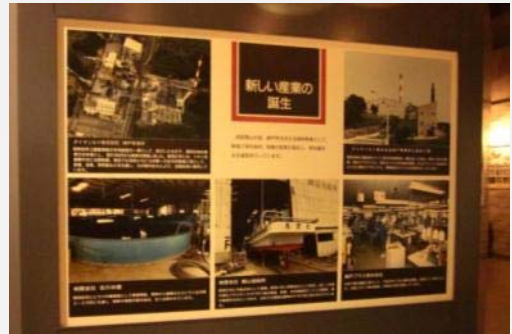
資料館ガイドの案内もあり、参加者のみなさんも様々な展示物に興味津々！