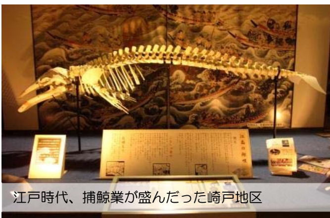
江戸時代、捕鯨業が盛んだった崎戸地区