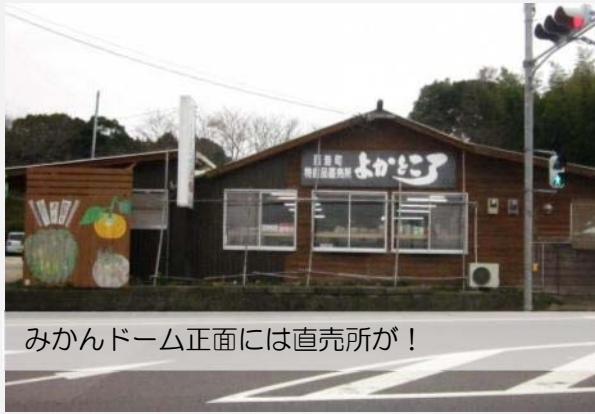
みかんどーム正面には直売所が！