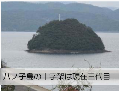
八ノ子島の十字架は現在三代目