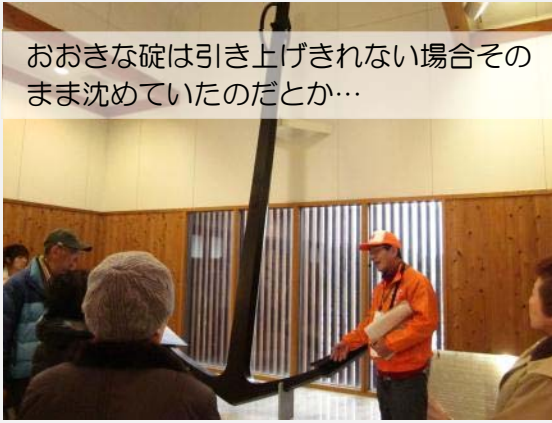
おおきな碇は引き上げきれない場合そのまま沈めていたのだとか…