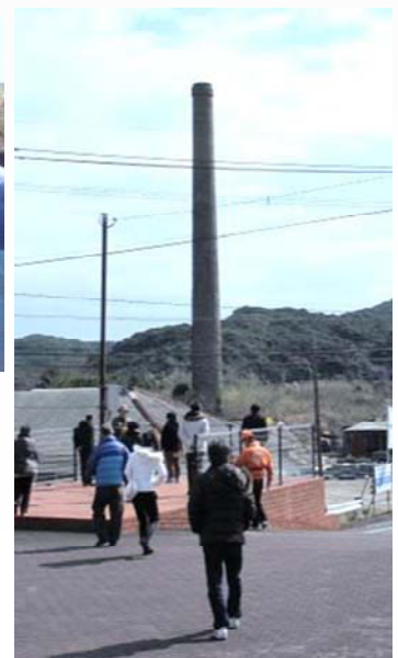
捕鯨、炭坑、そして閉山後は製塩業と基幹産業が変化してきた崎戸。資料館の外では今も残る煙突跡など炭坑ゆかりの遺構が多く点在しています。時間の関係上周辺施設をじっくり見て回る事はできませんでしたが、資料館正面に見える煙突跡はなかなかの迫力です。