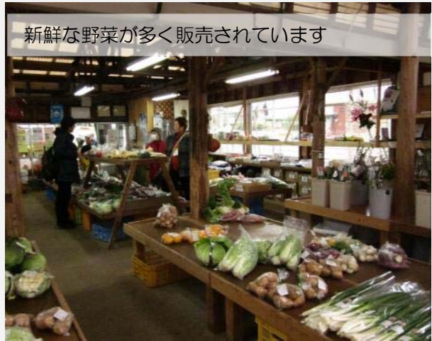
新鮮な野菜が多く販売されています