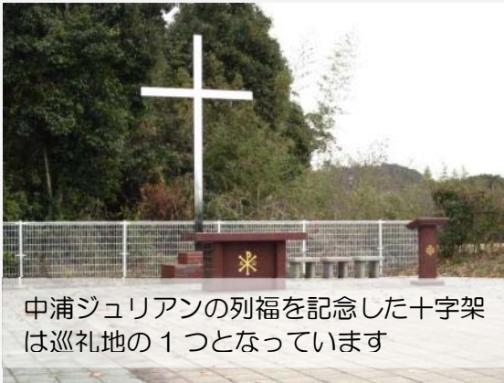
中浦ジュリアンの列福を記念した十字架は巡礼地の1つとなっています