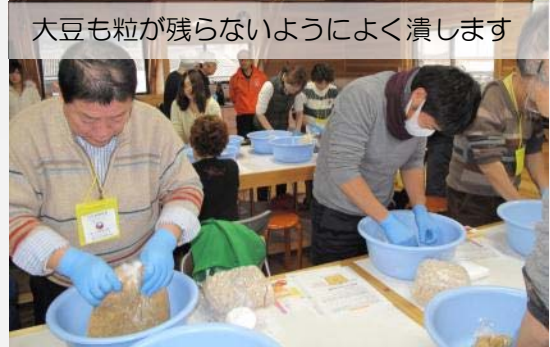
大豆も粒が残らないようによく潰します