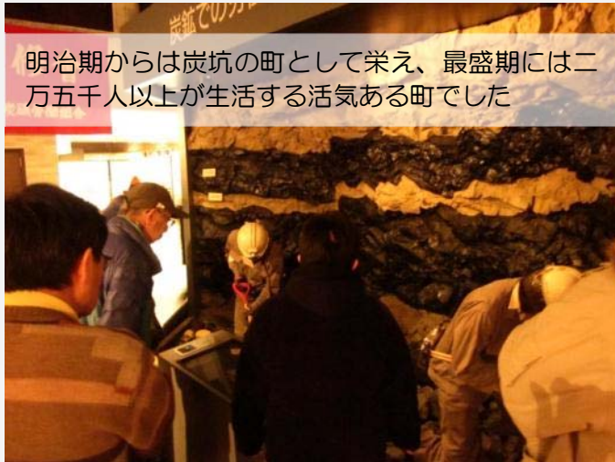
明治期からは炭坑の町として栄え、最盛期には二万五千人以上が生活する活気ある町でした