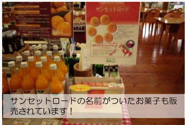
サンセットロードの名前がついたお菓子も販売されています！