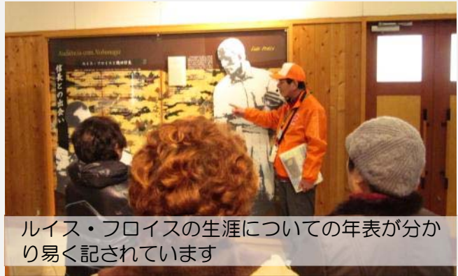
ルイス・フロイスの生涯についての年表が分かり易く記されています