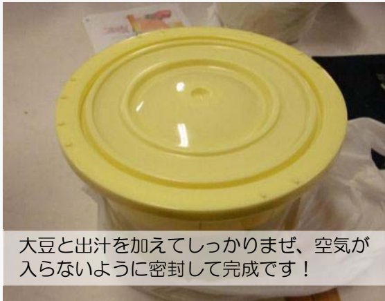
大豆と出汁を加えてしっかり混ぜ、空気が入らないように密封して完成です！