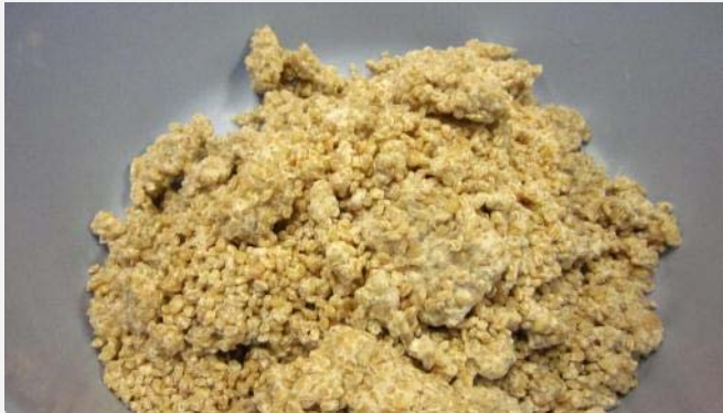
麦麴はしっかりほぐしましょう

ポイントは大豆を軟らかく煮てしっかり潰すことだそうです。大豆と麦麴を混ぜ合わせる工程はハンバーグづくりのようでした…皆さん味噌づくりはとても印象に残ったようです。