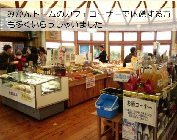
みかんどームのカフェコーナーで休憩する方も多くいらっしゃいました