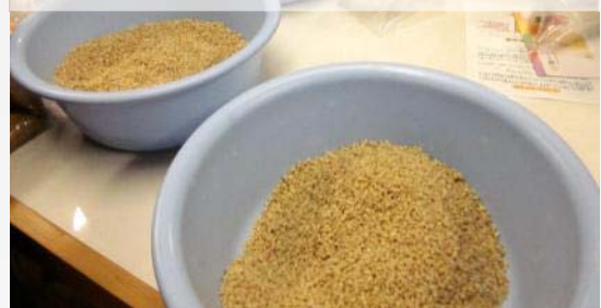
しっかりほぐして塩を混ぜ込んだ麦麴がコチラ