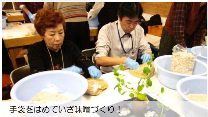
手袋をはめていざ味噌づくり！