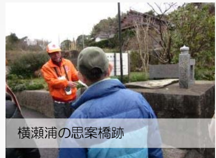
横瀬浦の思案橋跡

横瀬浦には「丸山」や「思案橋」、「上町」「下町」など現在の長崎市の中心市街地と共通する地名も多く残っており、焼き討ちに合う前は栄えた大きな港町だったことを伺わせます。 1時間ほどの散策コースでしたがあっという間の楽しい時間でした。