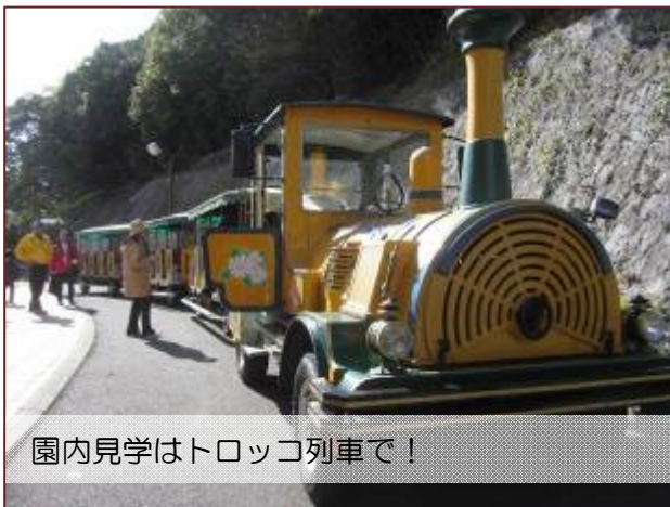
園内見学はトロッコ列車で!