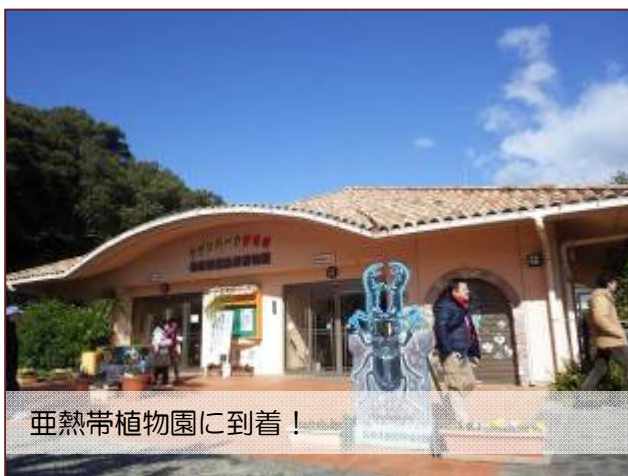
亜熱帯植物園に到着！