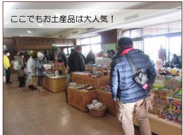
ここでもお土産品は大人気!