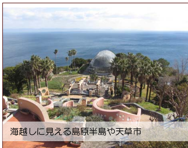
海越しに見える島原半島や天草市

亜熱帯植物園では、鉢植え体験と園内見学の2班に分かれ、交互に体験する事に。売店に隣接したベランダからは島原半島だけでなく、天草を見ることができました。天気が良ければ鹿児島まで見ることができそうです。