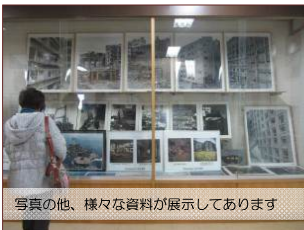
写真の他、様々な資料が展示してあります