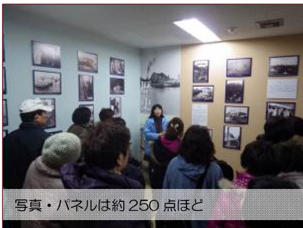
写真・パネルは約 250 点ほど