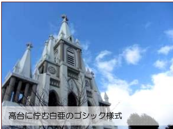
高台に佇む白亜のゴシック様式