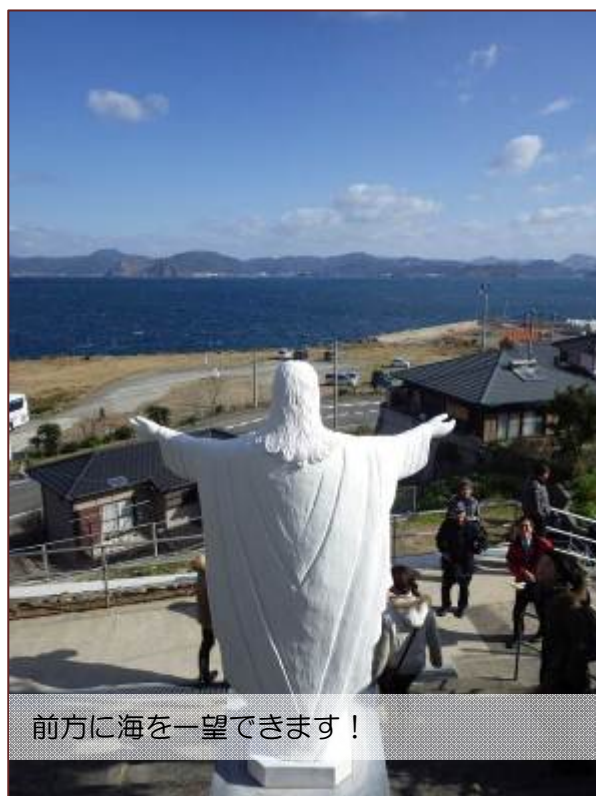
前方に海を一望できます！

伊王島の観光用臨時駐車場に到着してバスを降りると、馬込教会までは階段で登ります。高台にある教会からは海が一望でき、見晴らしも最高でした。馬込教会の正式名称は「聖ミカエル天主堂」と言いますが、そのほかに「馬込天主堂」「沖之島教会」「沖之島天主堂」「沖ノ島教会」「沖ノ島天主堂」「沖の島教会」「沖の島天主堂」と9つの名称を持つ教会としても知られています。島民の約60%がカトリック信徒である伊王島で唯一の教会というだけあり、美しいその佇まいを皆さん熱心に写真におさめていました。