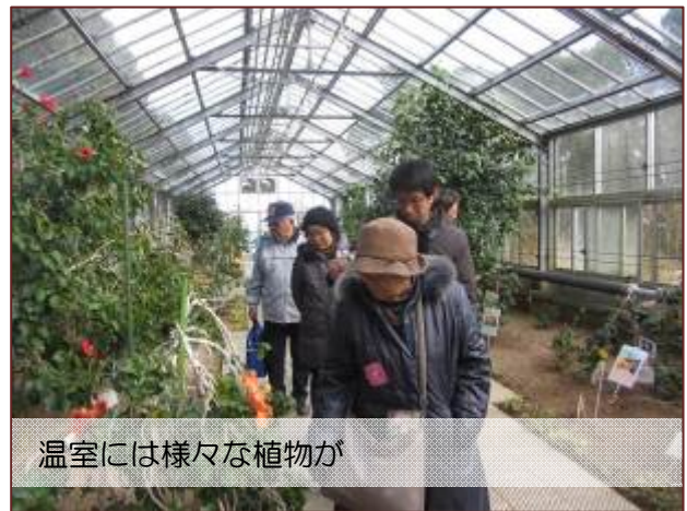
温室には様々な植物が