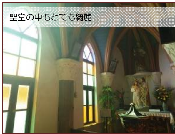
聖堂の中もとても綺麗