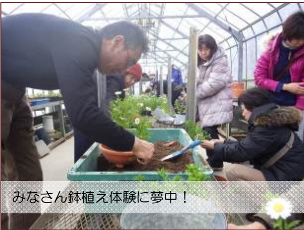
みなさん鉢植え体験に夢中!