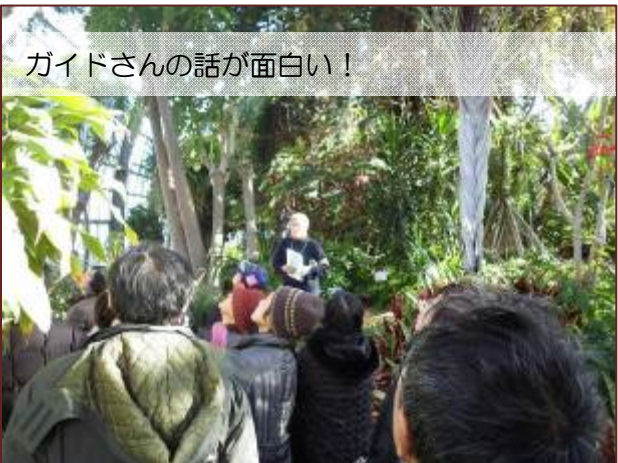
ガイドさんの話が面白い!