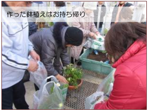
作った鉢植えはお持ち帰り