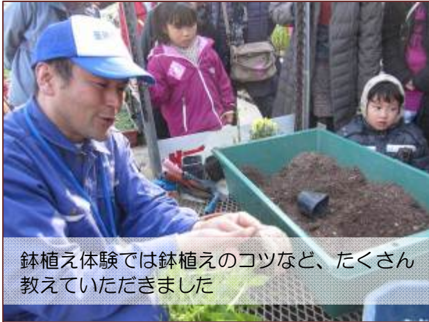
鉢植え体験では鉢植えのコツなど、たくさん教えていただきました