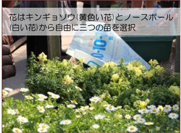
花はキンギョソウ(黄色い花)とノースポール(白い花)から自由に三つの苗を選択