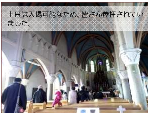
土日は入場可能なため、皆さん参拝されていました。