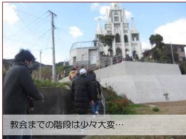
教会までの階段は少々大変…