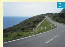
景-2 サンセットウェイ