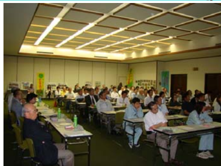
【会議の様子、今年も大勢の道守が参加】