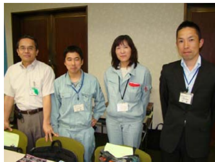
【佐世保市「道路アダプト事業」などのブース】