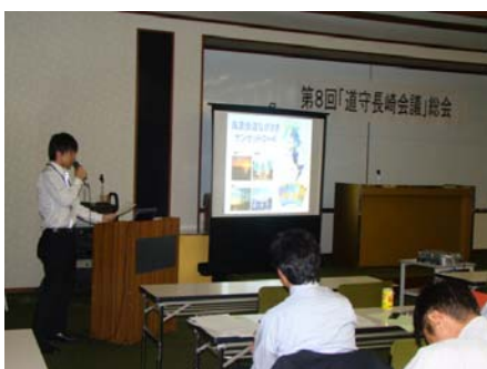
【風景街道の屋台紹介】