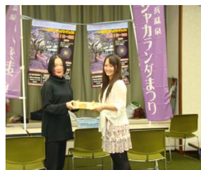
【惜しくも僅差の2位は「小浜温泉57」の皆さま】