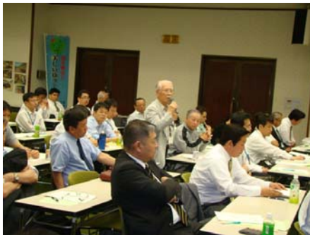
【参加者より活発な意見・質問が発言されました】