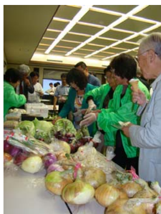
西海市大島町の「環境美化を考える会」の皆さんが栽培した元気野菜。【見事1位でした】