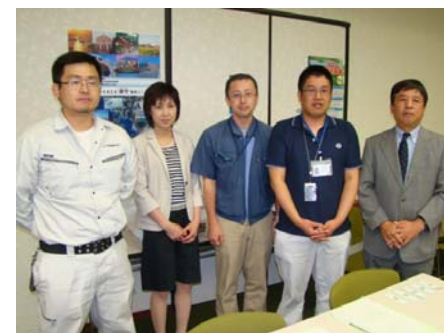
【長崎大学インフラ超寿命化センター】