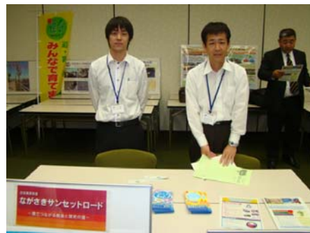
【風景街道「ながさきサンセットロード」のブース】