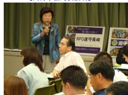
【西海地区の屋台紹介】